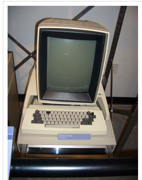
1973: Xerox Alto

Mientras que su uso fue limitado a los ingenieros en Xerox PARC, el Alto tenía características años adelantado a su tiempo. El Xerox Alto y el Xerox Star inspirarían al Apple Lisa y al Apple Macintosh.